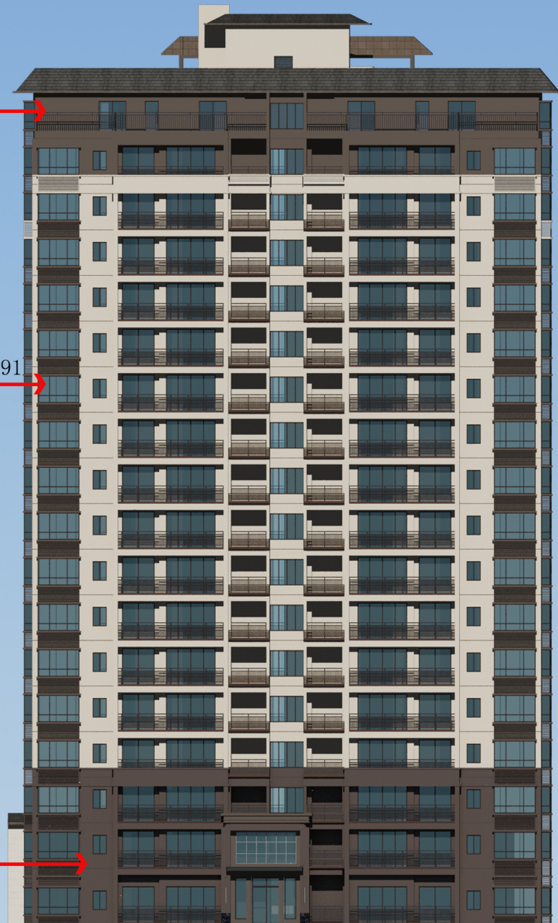
调整后塔楼立面颜色

广西华信工程 设计股份有限公司 Guangxi HuaXin Engineering Design Co.,Ltd. 工程勘察证书：甲级 B145005460 工程设计证书：甲级 A145005460 市政园林证书：乙级 A245005467