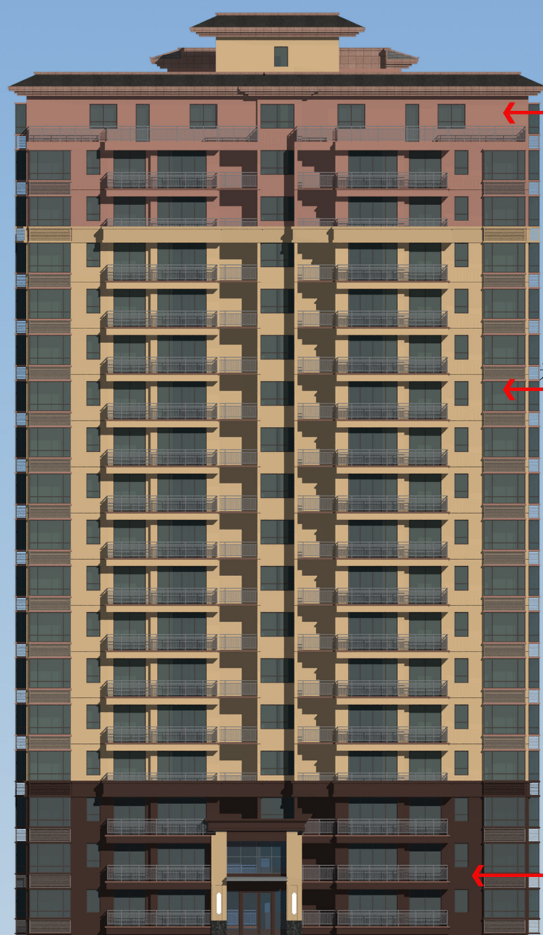
调整前塔楼立面颜色