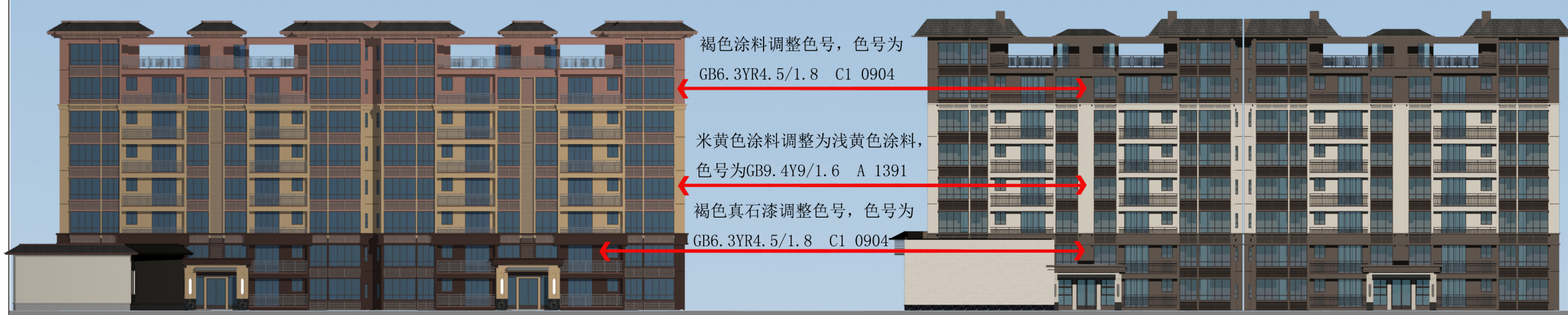
调整前板楼立面颜色