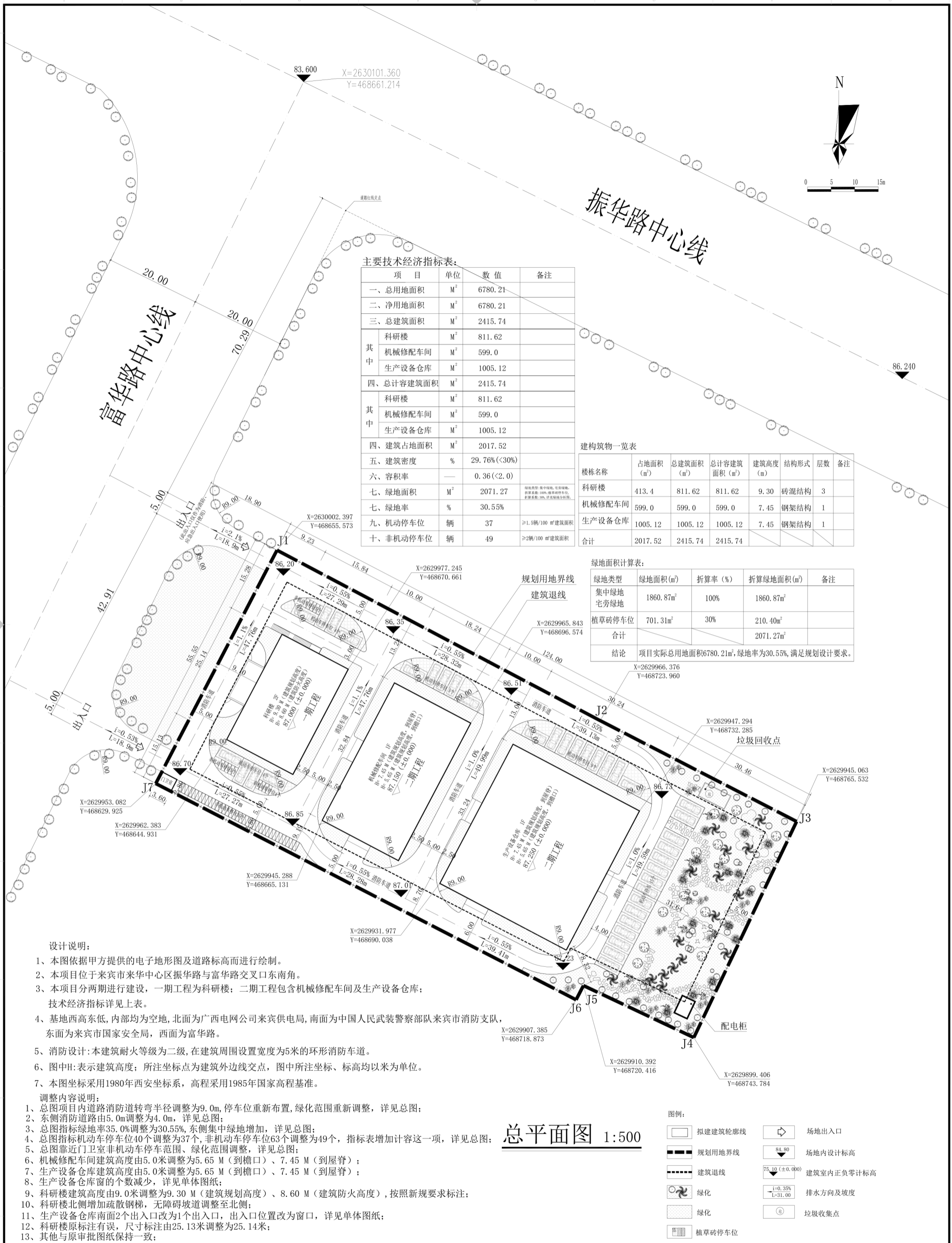
主要技术经济指标表: